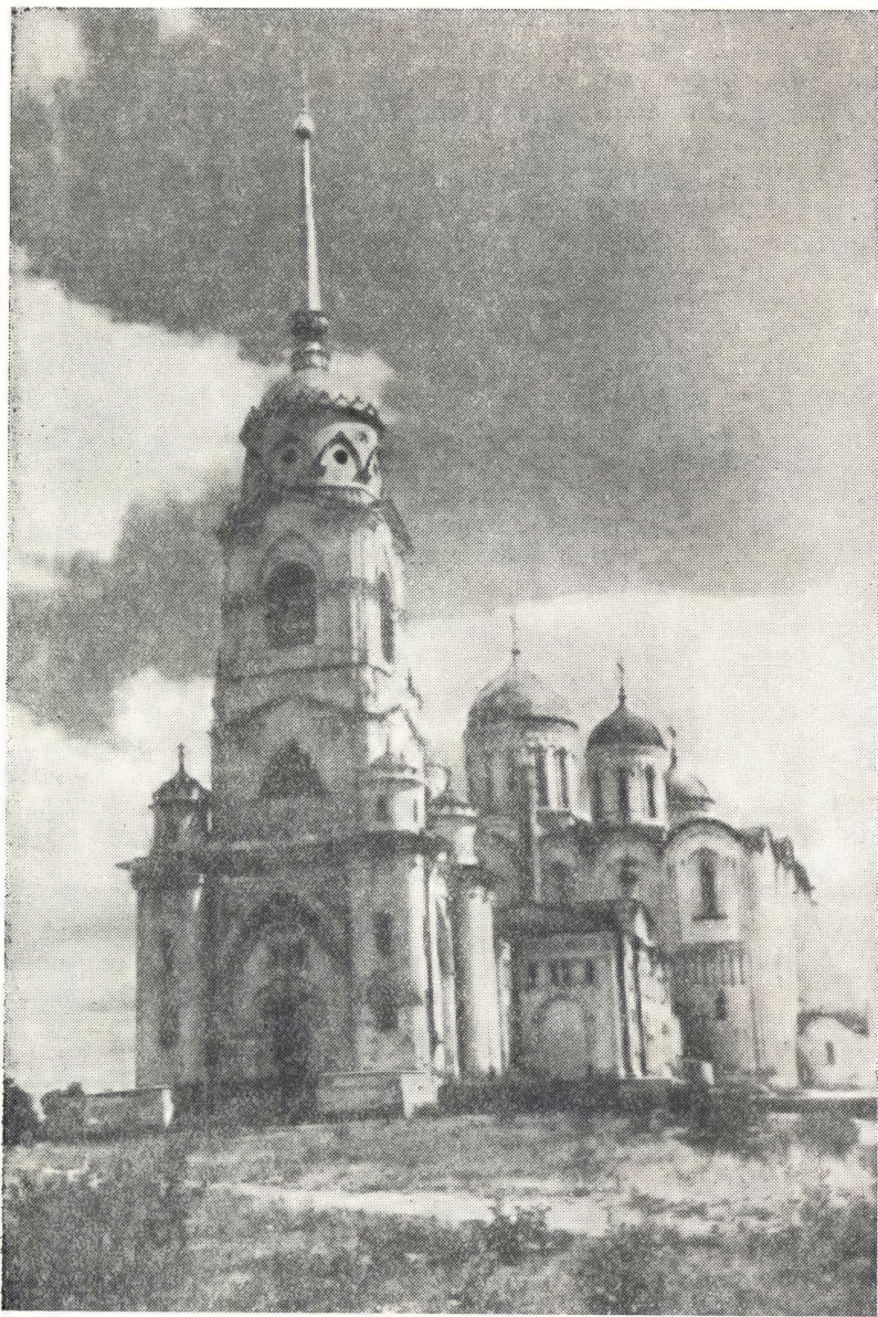
ОБЩИЙ ВИД УСПЕНСКОГО СОБОРА В г. ВЛАДИМИРЕ